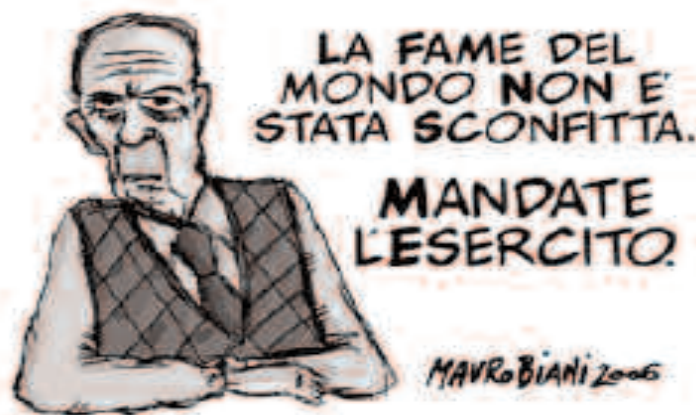
Vignetta di Mauro Biani tratta da www.peacelink.org

Le truppe americane in Iraq attualmente sono composte da 150.000 uomini e, se il Congresso USA a maggioranza democratica non avesse votato contro l'invio di ulteriori uomini, il repubblicano Bush si preparava a mandarne altri 21 mila.