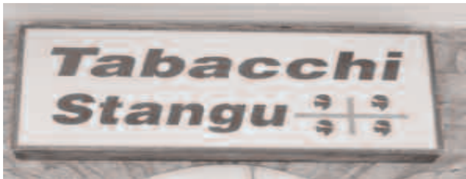
Duas insinnas bilinguas in Ballau

Custu serbitziu du pagat totu su Stadu italianu, cun sa lei 482/99, ki d'anti fata castiendi is atras natzionis de s'Europa de cumenti si ndi