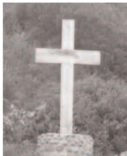
La croce danneggiata

Nella nuova piazza Sant'Isidoro sono state rubate le altalene. Erano state montate tra Natale e Capodanno e non sono durate neanche per Carnevale. Dal momento che non esiste un mercato dell'altalena rubata, niente di strano che