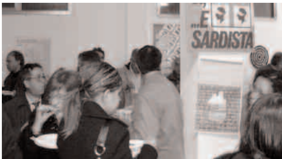
Il rinfresco dopo l'inaugurazione

Sfodera subito l'armamentario ideologico per le grandi occasioni, is botinus 'e certai , parlando di sovranità e di indipendenza, salvo ripie-