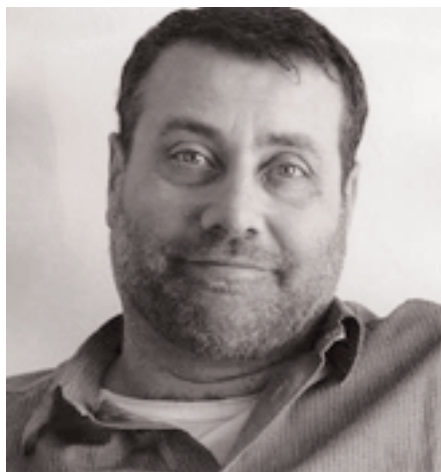
L'autore Massimo Carlotto. Ph. Carlotto

onesto e lavoratore che dopo il licenziamento lavora come magazzino per settecento euro al mese. La figlia, anche lei senza un nome, nonostante sia carina e attraente, si guadagna qualche soldo facendo piccoli lavoretti.