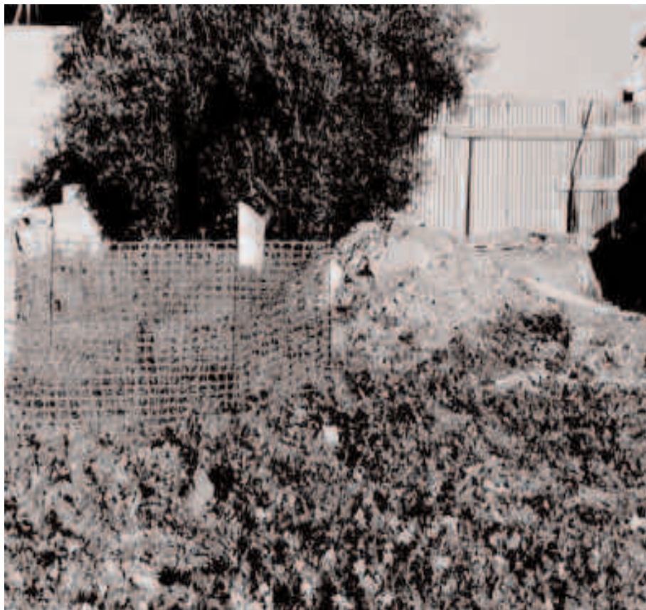
L'ulivo conteso, ora all'interno del cantiere.