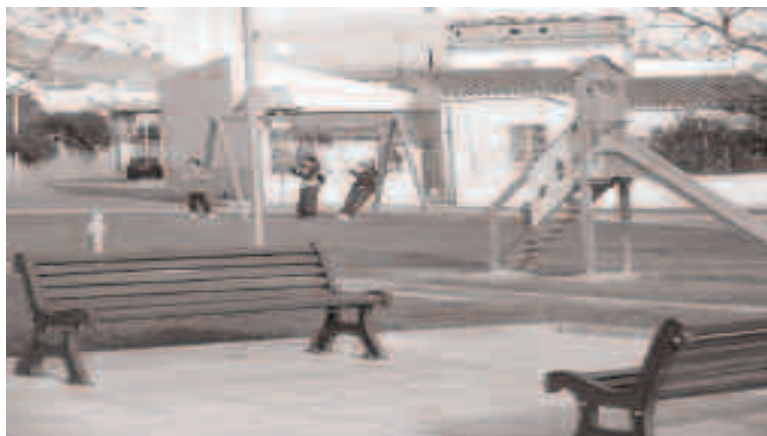
Quando le altalene c'erano ancora

siano andate ad arredare il giardino di qualche villetta a Solanas.