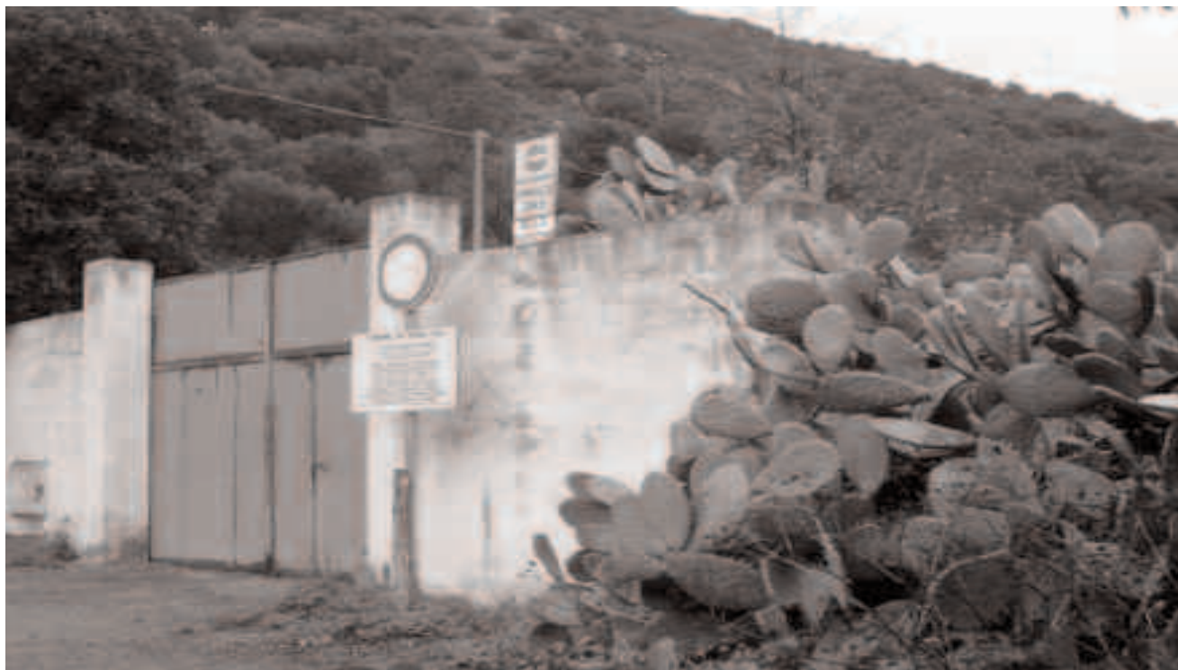
Sinnia. S'intrada de sa diga de Santu 'Artzolu