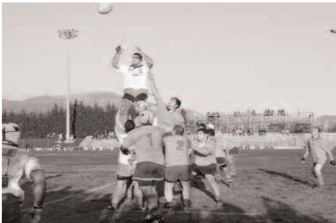
I giocatori sinnaesi sono quelli con la maglia gialla (qui grigia)

Dal 1980, anno in cui la società è stata fondata, di ragazzi la squadra ne ha visto crescere parecchi e molti di loro hanno avuto l'opportunità di partire a Treviso per il Trofeo "Topolino" o al "Torneo delle regioni", formando una rappresentativa regionale di 5-6 ragazzi. Il tutto dovuto alla grande cura che la società esercita sul vivaio, che spesso diventa il carburante per la categoria senior. [Sighit a palas]