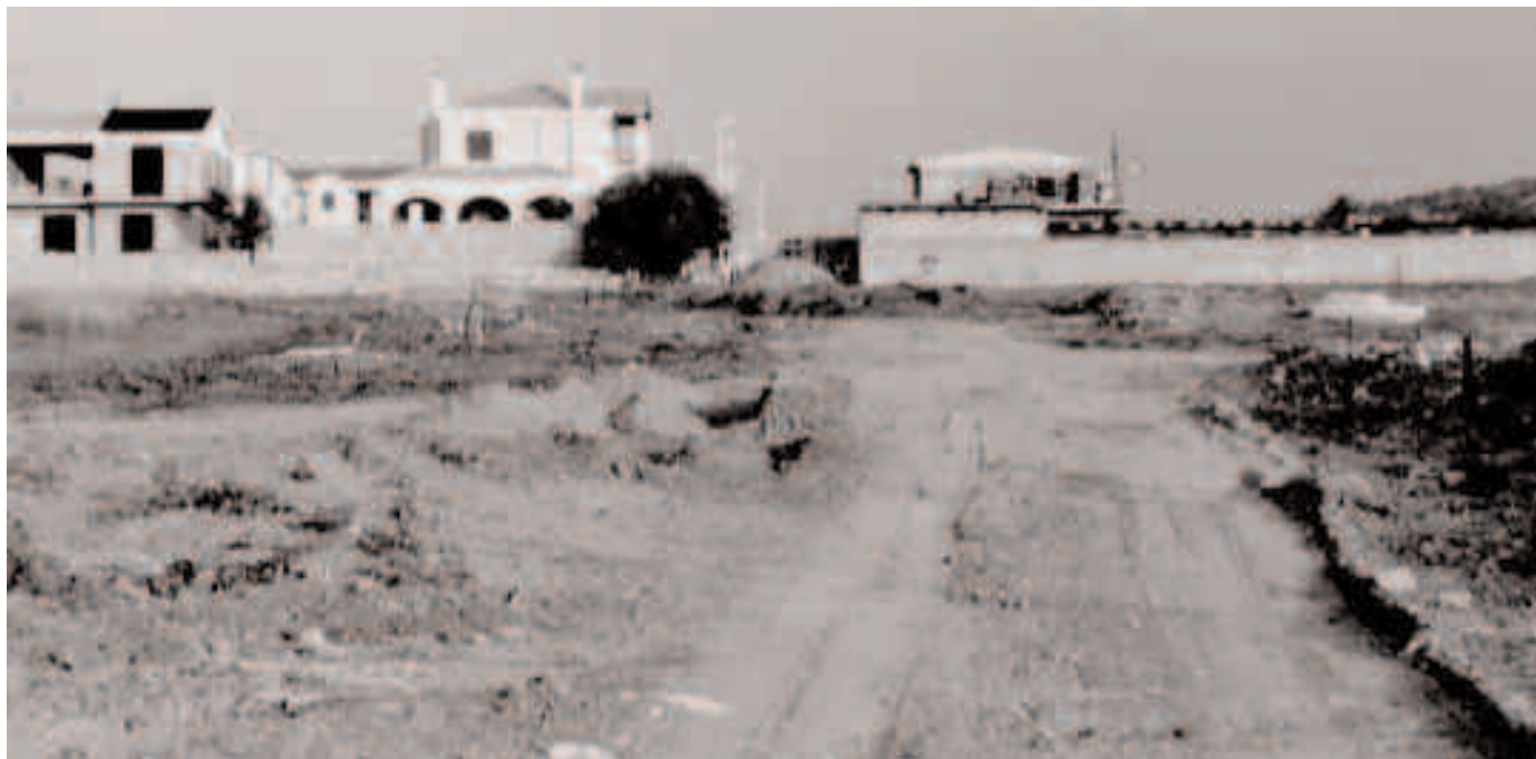
I lavori nell'area della lottizzazione prima che venisse recintata.