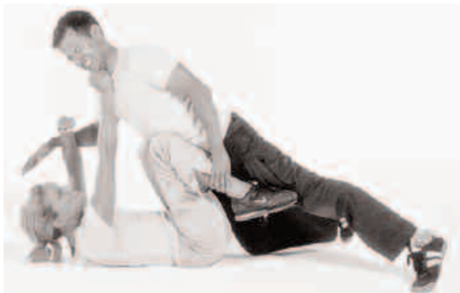
Un'esercizio del W.T.

Si ho subito un'aggressione da parte di diversi uomini. Non hanno avuto scrupoli né si sono posti il problema di prendersela con una