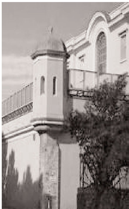
Su presoni de Buoncammino

Per questi casi Sinnai ha preso parte a un progetto a gestione associata insieme a Villasimius, Burcei e Maracalagonis. Il progetto - dichiara l'assessore Pusceddu "si basa su risorse regionali per il servizio alla