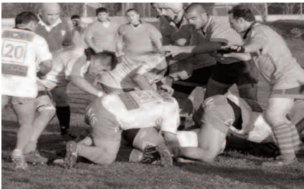
I giocatori sinnaesi sono quelli con la maglia gialla (qui grigia)

"Assieme a noi - continua il presidente - c'erano anche l'Alghero ed il Capoterra e con la trasformazione della serie C2 in serie C regionale abbiamo subito una retrocessione d'ufficio, siamo stati danneggiati. Ma preferiamo andare avanti come abbiamo fatto sempre, amando questo sport e giocando a livello amatoriale, il metodo che sicuramente ci ha regalato le più grandi soddisfazioni".