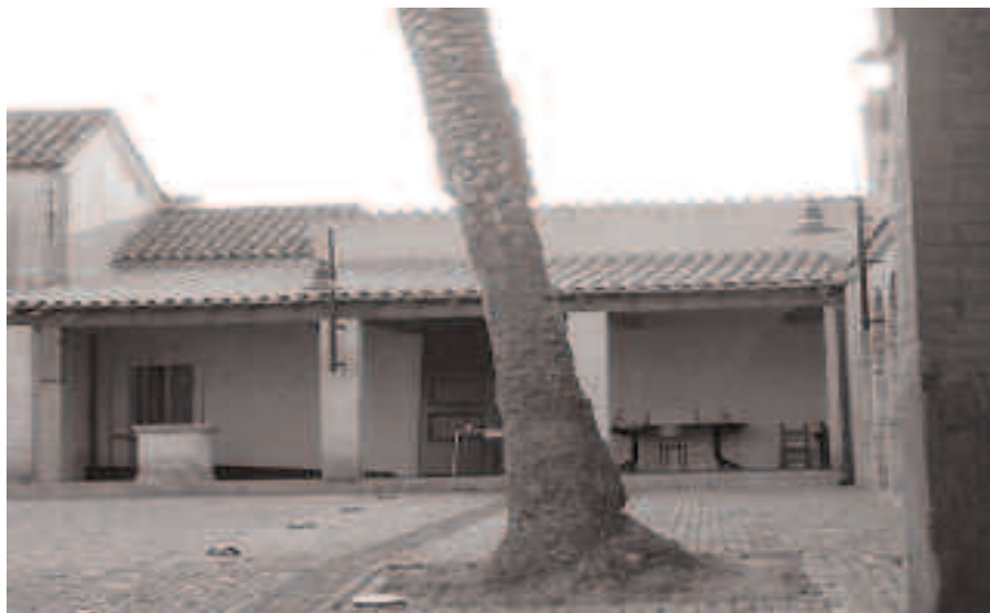
Settimo. Sa domu 'e is de Dessy

Settimo terranno invece i laboratori di impagliatura e cestineria, il lunedì e il martedì.