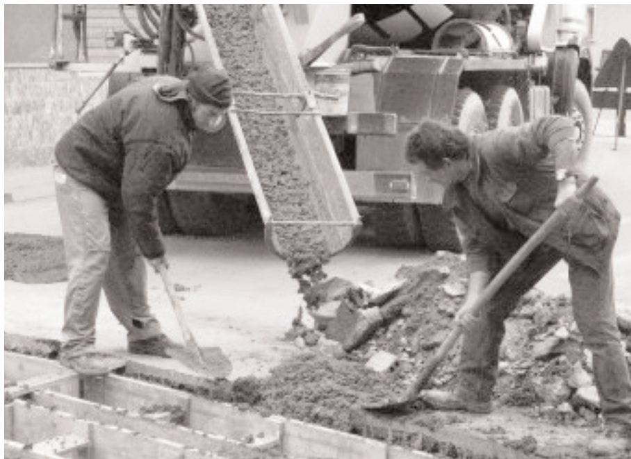
Is obraxus traballendi a s'arretza in sa 'ia